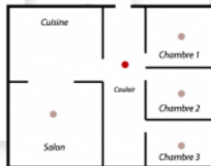
Habitation type Appartement