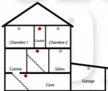
Habitation type Maison

L'implantation d'un ou plusieurs D.A.A.F. (Détecteur Avertisseur Autonome de Fumée) varie selon le type de logement.