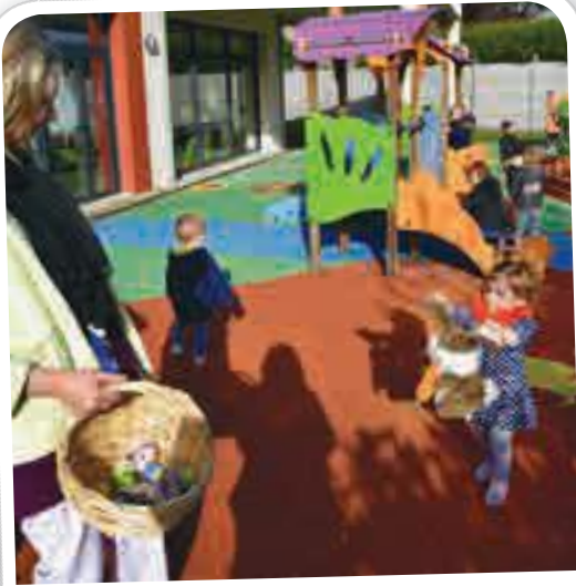
Le lapin de Pâques en visite à l'Îlot Câlin, le 6 avril