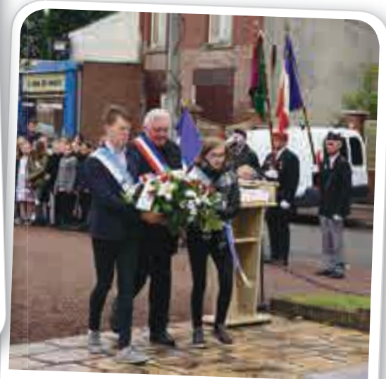
Commémoration de la libération de 1945, le 8 mai