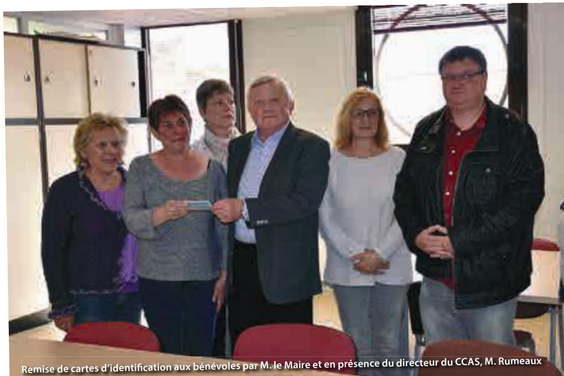
Remise de cartes d'identification aux bénévoles par M. le Maire et en présence du directeur du CCAS, M. Rumeaux

Portée par le CCAS, elle vise à faire intervenir des bénévoles formés chez les personnes âgées repérées comme fragiles et dépendantes. Les bénévoles auront notamment pour missions l'écoute des besoins et des difficultés rencontrées par les seniors, mais aussi la mise en place d'actions de prévention, de protection et de conseil. Lors de la rencontre, Monsieur le Maire n'a pas manqué de remercier l'implication des bénévoles et de souligner l'importance d'un tel dispositif en direction des personnes âgées sur la commune. Ce dispositif amplifie encore davantage l'action du CCAS. La signature d'une charte et la remise de cartes ont clôturé ce moment.