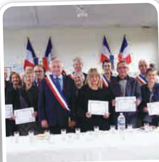
Les médaillés du travail, le 1 er mai