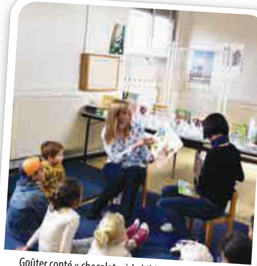
Goûter conté « chocolat » à la bibliothèque R. Devos, le 12 avril