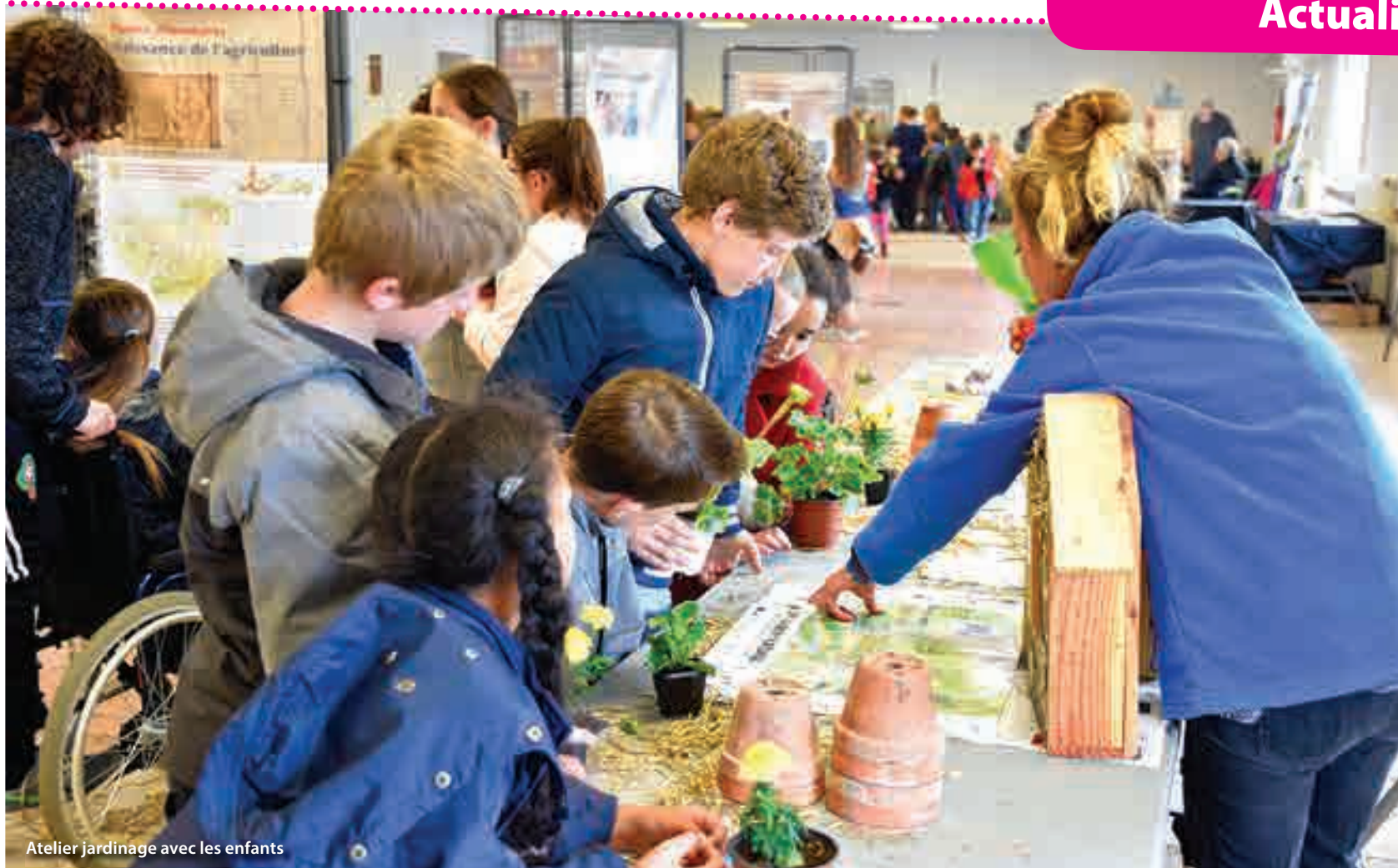
Atelier jardinage avec les enfants