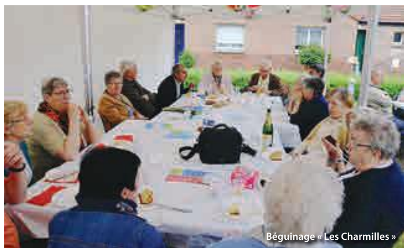
Béguinage « Les Charmilles »