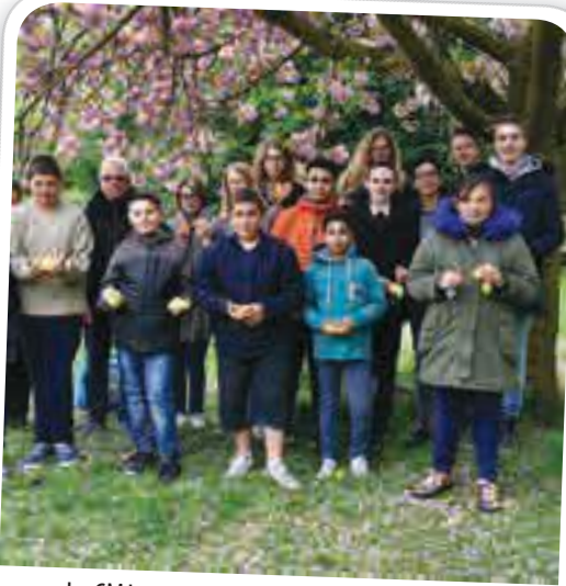
Le CMJ, organisateur de la chasse aux oeufs au Domaine de l'Epinoy