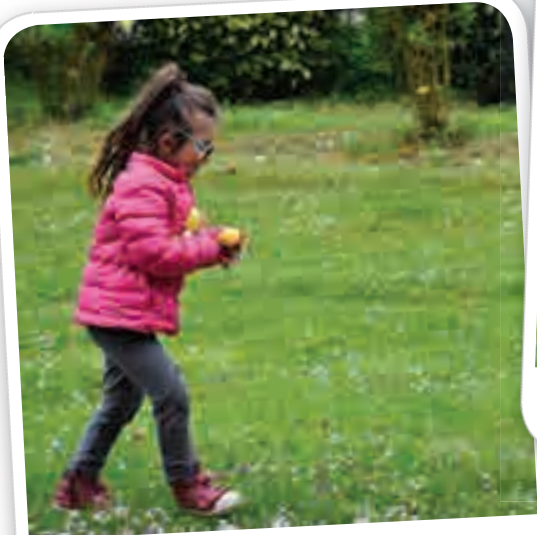
Chasse aux oeufs au Domaine de l'Epinoy, le 17 avril