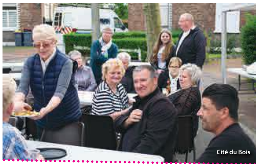
Cité du Bois