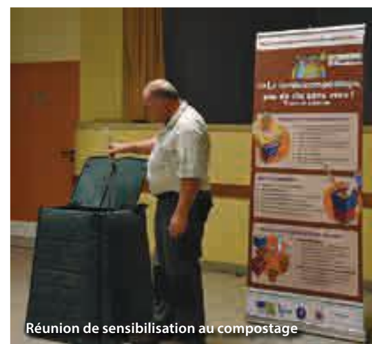
Réunion de sensibilisation au compostage

Parmi les partenaires, le SYMEVAD était représenté par ses guides composteurs pour des conseils sur le compostage et pour remettre les composteurs aux Libercourtois et habitants de la CAHC, suite à la réunion sur le compostage qui s'était tenue dans la semaine.