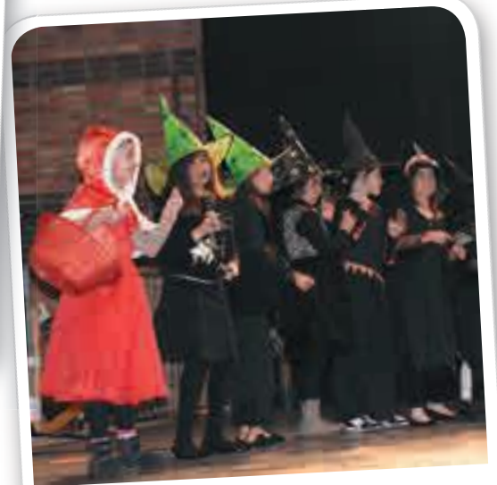
Spectacle des élèves de l'école Jean Jaurès, le 28 avril