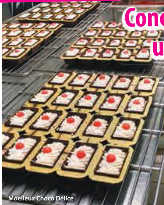
Moelleux Choco Délice

Faire adopter les bons réflexes dans l'assiette n'est pas toujours facile, surtout avec les plus petits. C'est un apprentissage qui doit se faire à la maison mais également à l'extérieur.