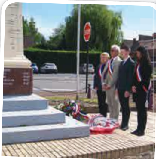
Commémoration de la Journée des Déportés, le 29 avril