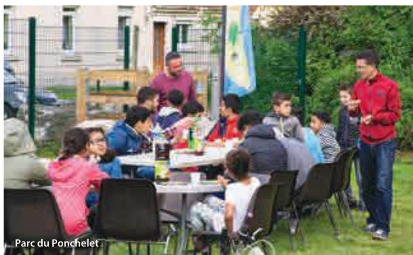
Parc du Ponchelet