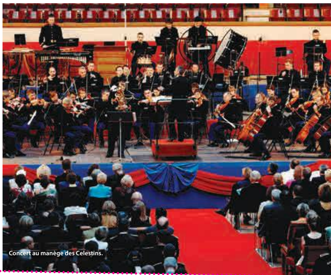
Concert au manège des Célestins.

C'est celui de mon premier concert important avec la Garde Républicaine, en 2002. Chaque année, il y a trois concerts organisés au manège des célestins, là où les chevaux sont entraînés. J'étais soliste et jouer devant 2000 personnes, c'est quelque chose de très impressionnant.